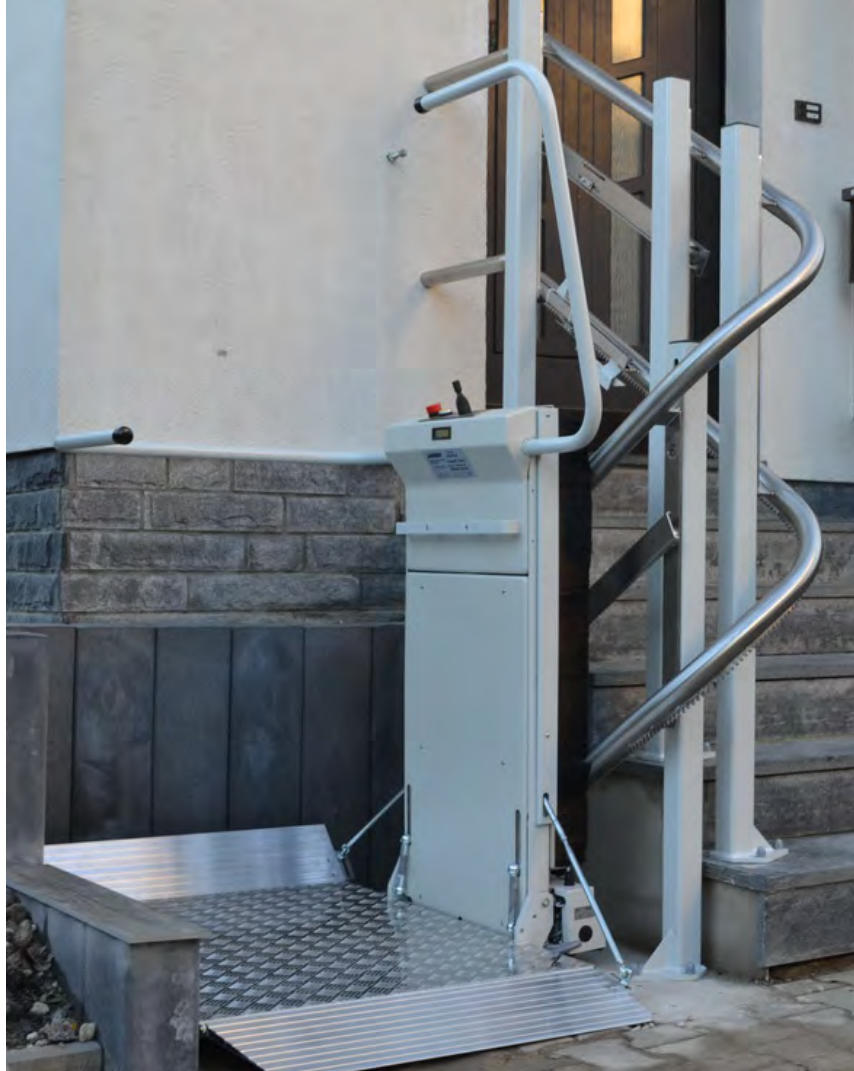
Kompaktes Design erlaubt Montage in engen Treppnhäusern

Vollautomatische Plattformfunktionen und ergonomische Befehlsgeber erlauben eine einfache und komfortable Bedienung.